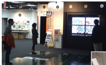
←公共施設での 利用例