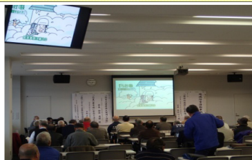
←講習会での利用例