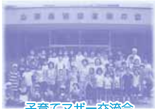
子育てマザー交流会

家族旅行、お母さん交流会、マザー交流会等数々の事業も実施しておりますので、ぜひ仲間作りに参加してください。